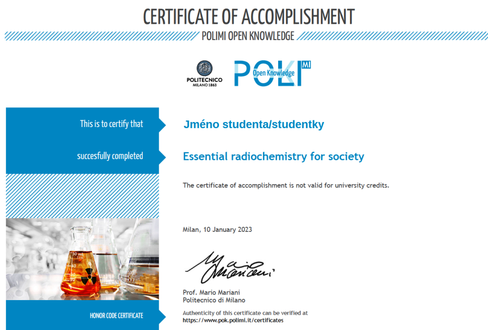
Obr. 2. Ukázka osvědčení po úspěšném zakončení kurzu MOOC

První týden připomene účastníkům stavbu atomu a jádra, seznámí ho s přirozenou radioaktivitou a definicemi základních pojmů (modul 1 je rozepsán později podrobněji). Stručně seznámí s jaderným palivem, principy radiochemických separačních metod a představí interakci ionizujícího záření s hmotou. Prostor je věnován i principu detekce ionizujícího záření. Zajímavé jsou i články o vztahu radioaktivity a těžby ropy a zemního plynu nebo výroby fosforečných hnojiv, nebo video