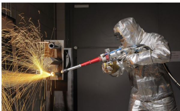
Obr. 1. Ukázka tepelného řezání z lekce „Vyřazování jaderných zařízení z provozu“

Třetí lekce již přináší přehled celého modulu a vysvětluje první pojmy důležité pro pochopení připravených témat a konceptů. V rámci dalších lekcí jsou už systematicky definovány a na konkrétních příkladech představeny pojmy a principy. Vše je doplněno fotografiemi, obrázky (ukázka na obr. 1), schémata, tabulkami nebo grafy, sloužícími nejenom pro lepší vysvětlení pojmů, ale i zatraktivnění materiálů.